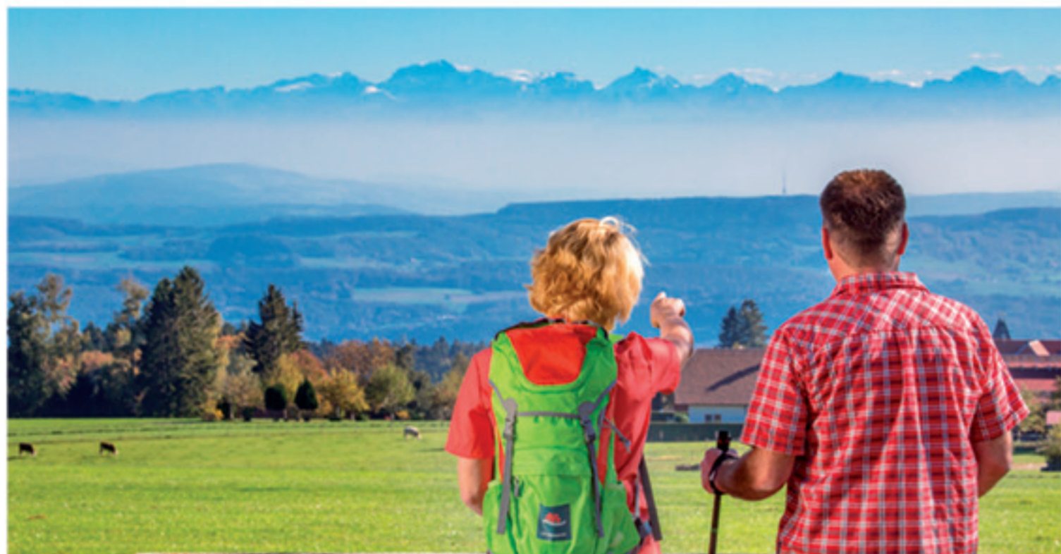
📷 BLICK AUF DIE ALPEN