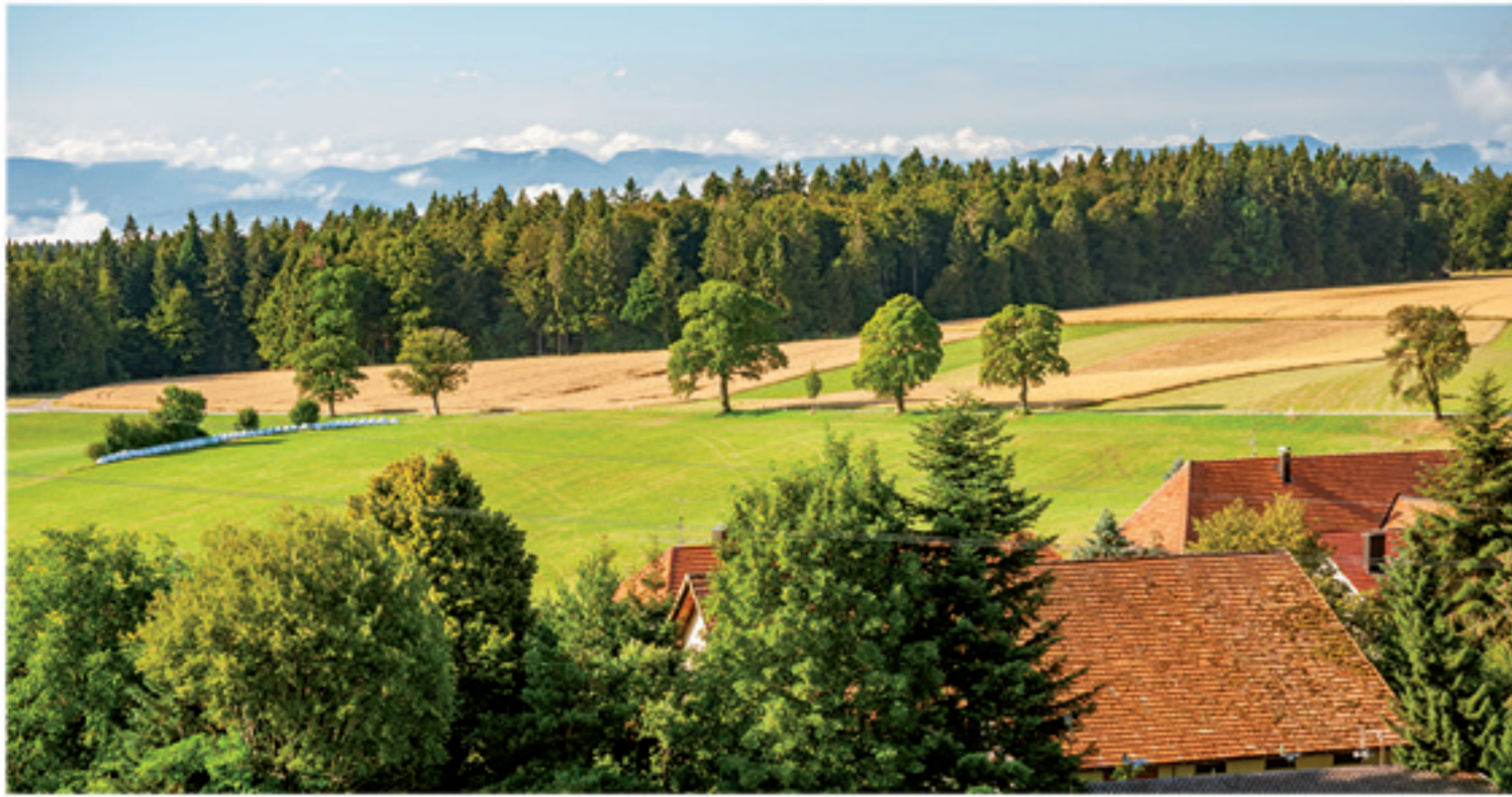
📷 BLICK AUF DIE ALPEN